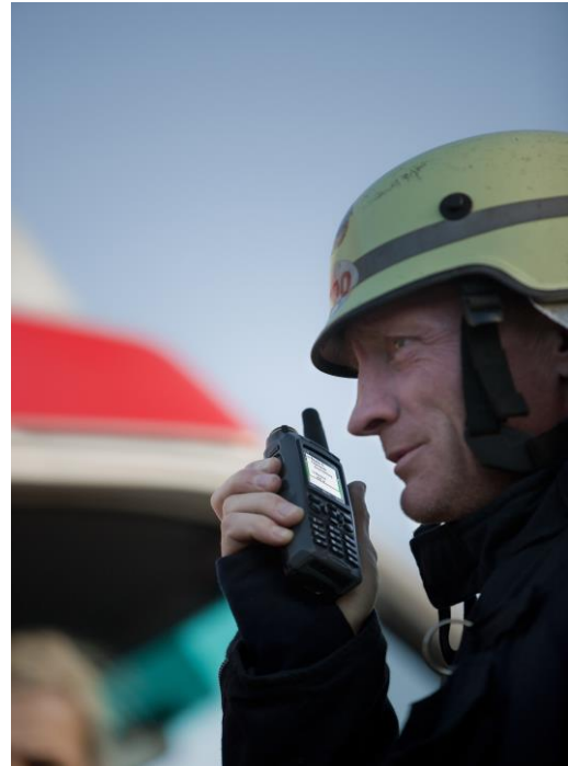
Funktionen der TETRA-Funkgeräte werden für die Sirenensteuerung nur minimal benötigt

Diese Trennung ist notwendig, da bei technischen Statusmeldungen eine Callout Number Referenz wie bei einer Alarmierung nicht vorliegen kann. Die Verwendung des SDS-Status erlaubt außerdem eine Anzeige der technischen Statusmeldungen auf jedem beliebigen vorhandenen TETRA-Statustableau – und dies unabhängig von den Rückmeldungen der Alarmierungen an die auslösende Stelle. Zusätzlich wird eine Erweiterung der Callout Funktion „Availability Request“ zur gezielten Abfrage der