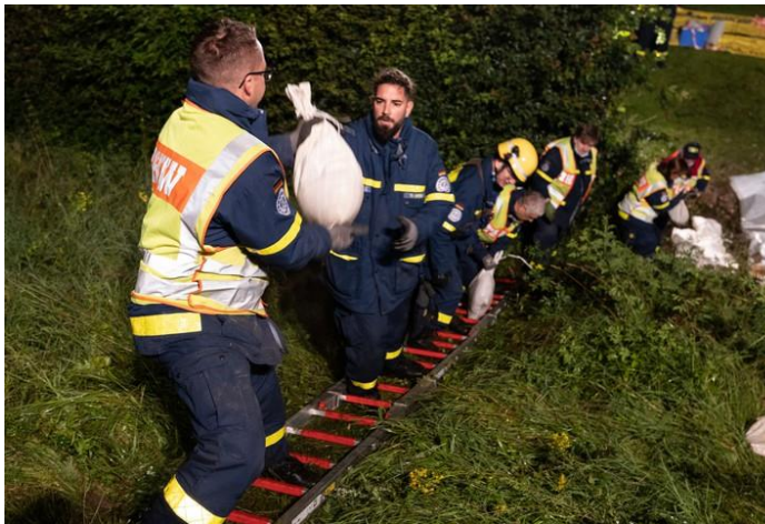
Einsatzkräfte des THW bei der Flutkatastrophe 2021

Umsetzung der Sirenenalarmierung im Digitalfunk BOS. Dieser Beitrag skizziert das Lösungskonzept. Außerdem werden in der Handreichung Sicherheitsaspekte im Rahmen der funktionalen, operativen und materiellen Sicherheit betrachtet.