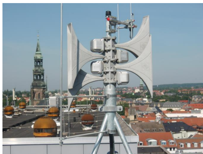
Die Sirenenalarmierung ist aktueller denn je

nisationen mit Sicherheitsaufgaben (Digitalfunk BOS) in Deutschland, aber auch für zukünftige Kommunikationssysteme der BOS zu erarbeiten.